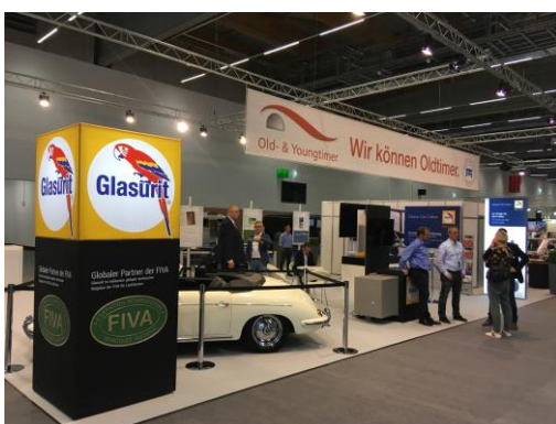
Le stand de Glasurit était situé sur le stand de la Fédération allemande des métiers de l'automobile.